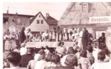
Než vznikl kamenný divadelní sál, hrálo se i pod širým nebem u sokolovny (1934)