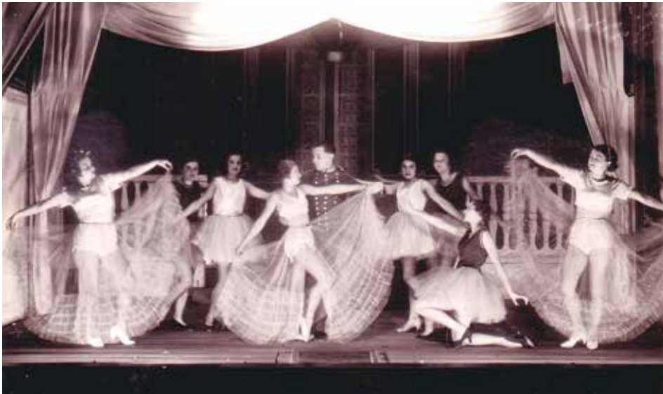
Ochotníci působili v Hostivaři již před vznikem Malého divadla, zde v sokolovně při představení Carevnin pobočník (1934)

Hrálo např. ve velmi populárním lesním divadle v Krči nebo na takzvaných divadelních nedělích organizace Radost ze života. Ta ve svém listu Pestrý týden napsala, že „v jejich spolku panuje opravdu kamarádský duch, hraní divadla jim je čímsi více než povrchní společenskou zábavou“.