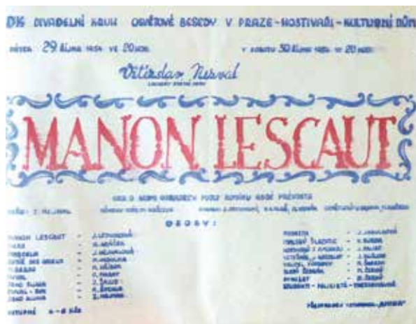
Manon je motýl. Manon je včela. Manon je růže, hozená do kostela

čehož notně využívala komunistická propaganda (komunistická strana stavbu domu zaštitila). Dle dobové publicistiky se mezi místními vybralo necelého čtvrt milionu korun do začátku, přípravy stavby začaly v půli července 1947, samotný projekt byl vypracován v listopadu a za necelý rok kulturní dům stál. Slavnostně otevíral 29. srpna 1948 a Hostivař tak dostala po sokolovně druhý a největší kulturní prostor: malý a velký sál pro přednášky, taneční zábavy a divadlo (s vyni-