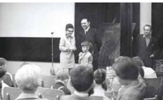
Kulturní dům sloužil i pro populární estrádní představení