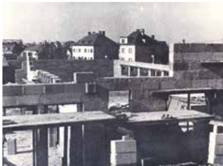
Stavba kulturního domu s divadelním sálem probíhala na přelomu let 1947–1948

čehož notně využívala komunistická propaganda (komunistická strana stavbu domu zaštitila). Dle dobové publicistiky se mezi místními vybralo necelého čtvrt milionu korun do začátku, přípravy stavby začaly v půli července 1947, samotný projekt byl vypracován v listopadu a za necelý rok kulturní dům stál. Slavnostně otevíral 29. srpna 1948 a Hostivař tak dostala po sokolovně druhý a největší kulturní prostor: malý a velký sál pro přednášky, taneční zábavy a divadlo (s vyni-