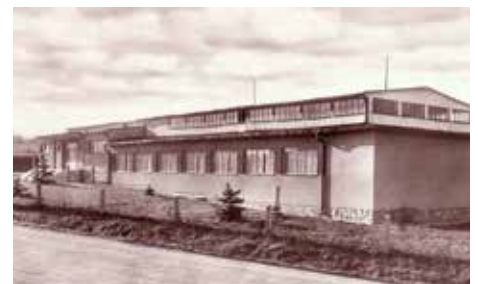
Divadelní sál slavnostně otevíral 29. srpna 1948 (snímek je z roku 1975)