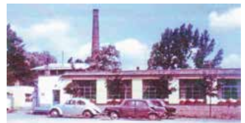
Papírny v 70. letech, dnes na místě někdejší tovární stojí sportovní hala s tenisovými kurty