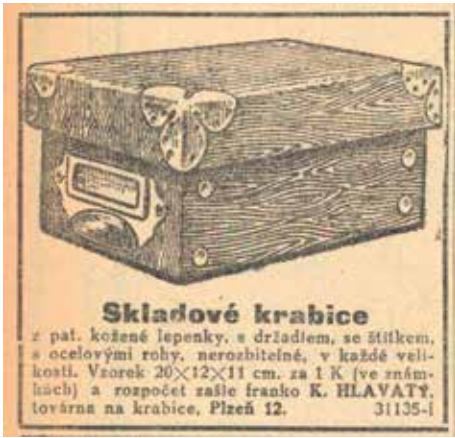
Papírové krabice s ocelovými rohy patřily k nejprodávanějším výrobkům továrny Karla Hlavatého