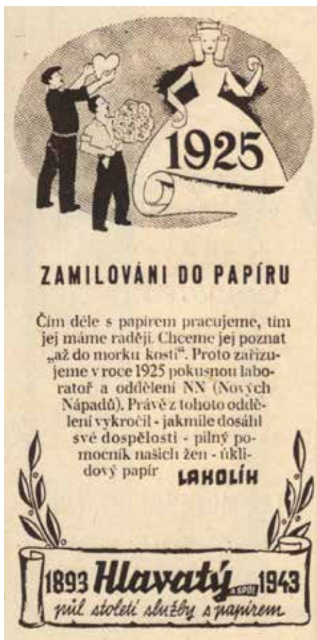
K 50. výročí firmy připravili Hlavatí originální sérii padesáti reklam otiskovaných v denním tisku, kde odlehčenou formou připomínali každý rok své historie