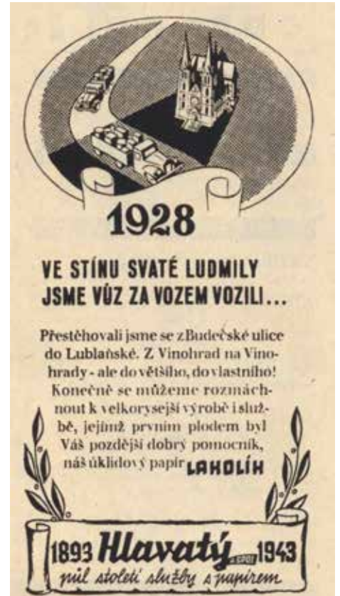
Pevný a omyvatelný papír Lakolík byl vůbec největším úspěchem podniku a nechyběl snad v žádné rodině, dal se použít i jako ubrus nebo tapeta

To už ale prostory v Budečské nepostačovaly a roku 1928 papírny zakoupily větší dům v Lublaňské ulici, kam se nastěhovalo veškeré