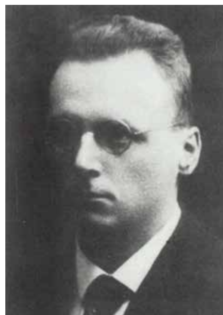
Budoucí spisovatel Eduard Bass v době, kdy se zaučoval v oboru kartáčnictví a kdy stejně jeho otec předpokládal, že rodinnou firmu převzeme