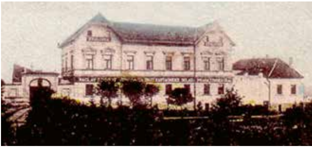
Po skromné dílně v centru Prahy vyrostlo zázemí firmy v sousedství železnice v Hostivaři

hřebeny, štětky nebo štětce. Vše pochopitelně v nejlepší jakosti. Již v lednu 1889 „kvůli pohodlí svých ctěných pánů zákazníků“ rozšířil zázemí obchodu do Týnské ulice čp. 629 na dohled Staroměstského náměstí. Do tohoto domu, kde dnes najdeme luxusní hotel Černý slon, se s podnikatelem přestěhovala i celá rodina. Obchodu se dařilo, a tak prodejnu v Mostecké ulici držel Schmidt dál a pokrýval hned dvě starobylé městské části.