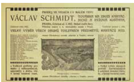
Firma nabízel široký sortiment výrobků od domácích potřeb po velké armádní zakázky (1909)

Národní politika v roce 1900 popisuje těžkosti pražských kartáčníků, kterých je ve městě prý už tolik, že je problém se řemeslem uživit. Přitom jej často provozují lidé nevyškolení, kteří navíc zboží nabízejí pod cenou a ničí tak obchodní podmínky. Hauzirnictví neboli podomní prodej je třeba vymýtit. Dokonce společenstvo přímo vyzývalo své vlastní mistry, aby odmítali nabírat další učně, protože jich bude nadbytek. Stejně tak zástupci požadovali, aby stát zakázal provozovat kartáčnictví ve věznicích, protože i odsouzcenci brali práci poctivým řemeslníkům. Čtenář ctěného listu by došel k závěru, že není horšího nápadu než se vydat cestou poctivého