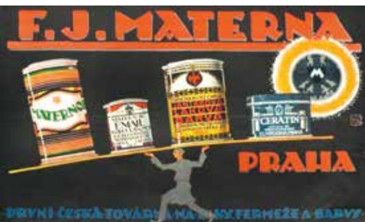
Výrobky „první české továrny na barvy a fermeže“, mezi nejznámější značky patřily Emailit, Maternol, Ceratin nebo Efima