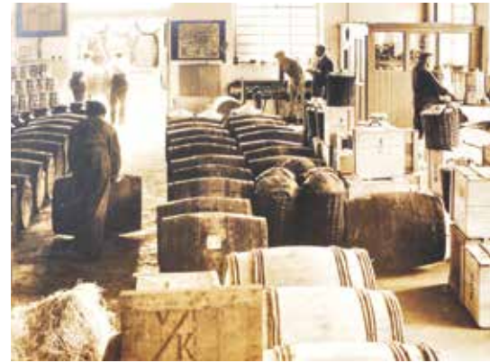
Firma začínala skromně, ale vypracovala se na předního výrobce barev v zemi