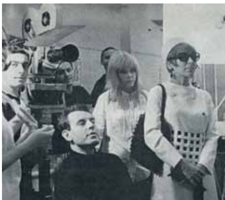
Miloš Forman (na snímku z natáčení s E. Pilarovou a H. Hegerovou) režíroval Dobře placenou procházku po čtyřiceti letech i v Národním divadle

Celkově se sešel silný tým tvůrců. Pan kameraman Kučera není žádný začátečník, už má za sebou filmy jako Až přijde kocour s Janem Werichem nebo povídkové Hrabalovy Perličky na dně (později nasnímá i takové klasiky české kinematografie jako Noc na Karlštejně , Jáchyme, hoď ho do stroje anebo Adéla ještě nevečeřela ).