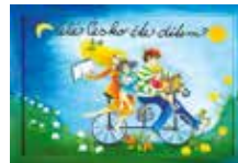
10. Týden čtení dětem v ČR slavíme i u nás Praha 15 se zapojila vydáním vlastního knižního titulu