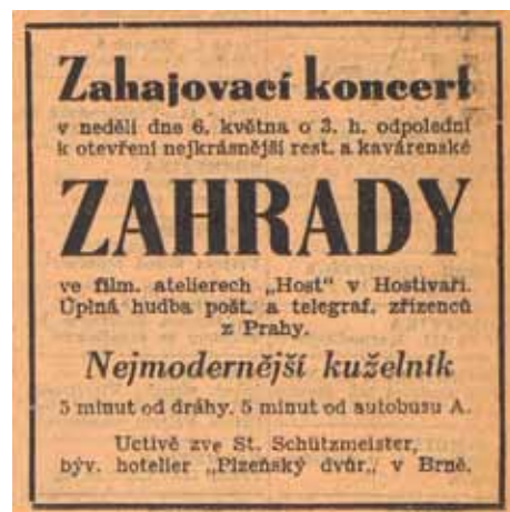
Na nejmodernější kuželník zvala místní restaurace v roce 1934 (Expres)