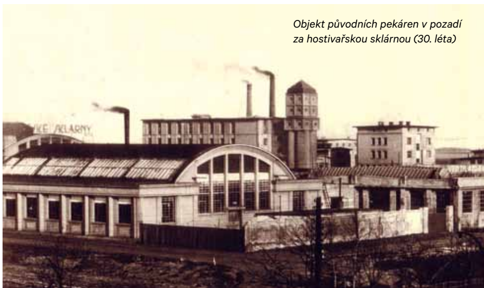
Objekt původních pekáren v pozadí za hostivařskou sklárnou (30. léta)

Tři ateliéry, synchronizační studio, bazén, šedesát sáten, dvanáct dalších místností pro