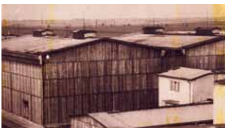
Původní dřevěné budovy filmových ateliérů zničené požárem v roce 1945