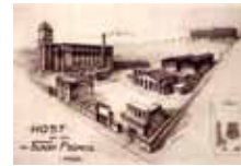
HOST - RESTAURACE FILMOVÝCH HVĚZD Historie