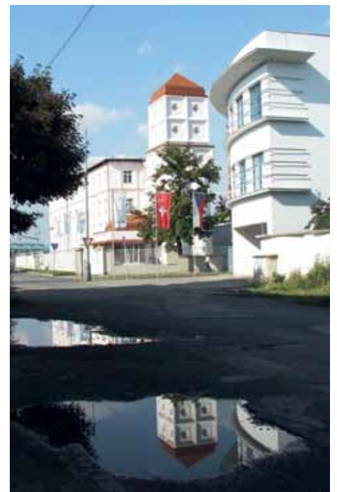
V dominantním sílu někdejších mlýnů, jedné z nejzajímavějších budov Hostivaře, dnes sídlí kanceláře