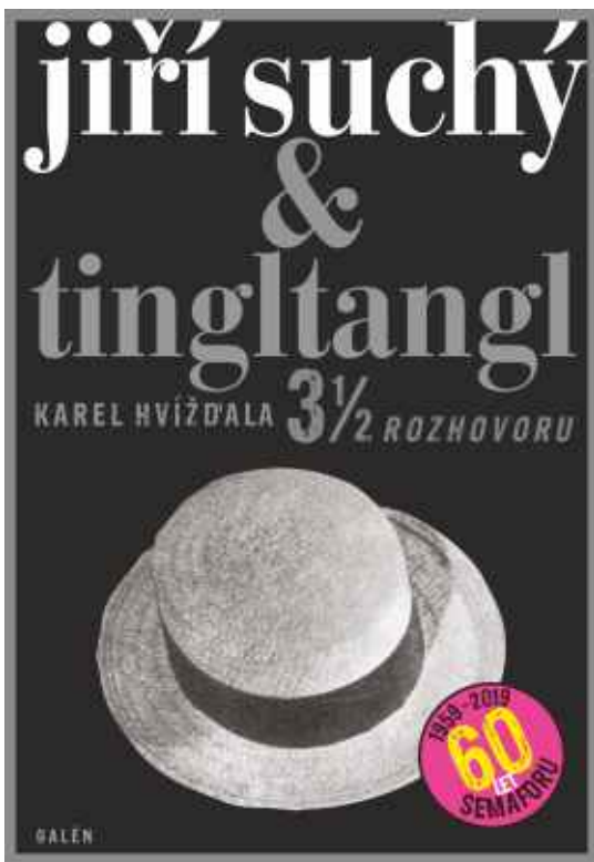
Jiří SUCHÝ & TINGLTANGL 3½ ROZHOVORU – Karel Hvíždala Vyjde na podzim v nakladatelství Galén k 60. výročí divadla Semafor (140x200, 560 stran, vázané)