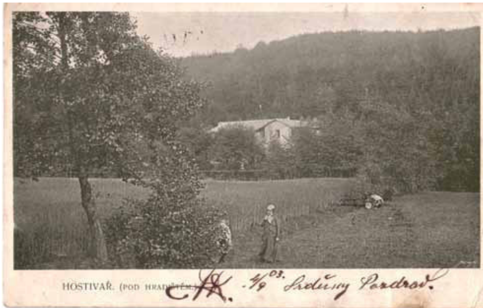
Historický pohled na restauraci Pod Hradištěm