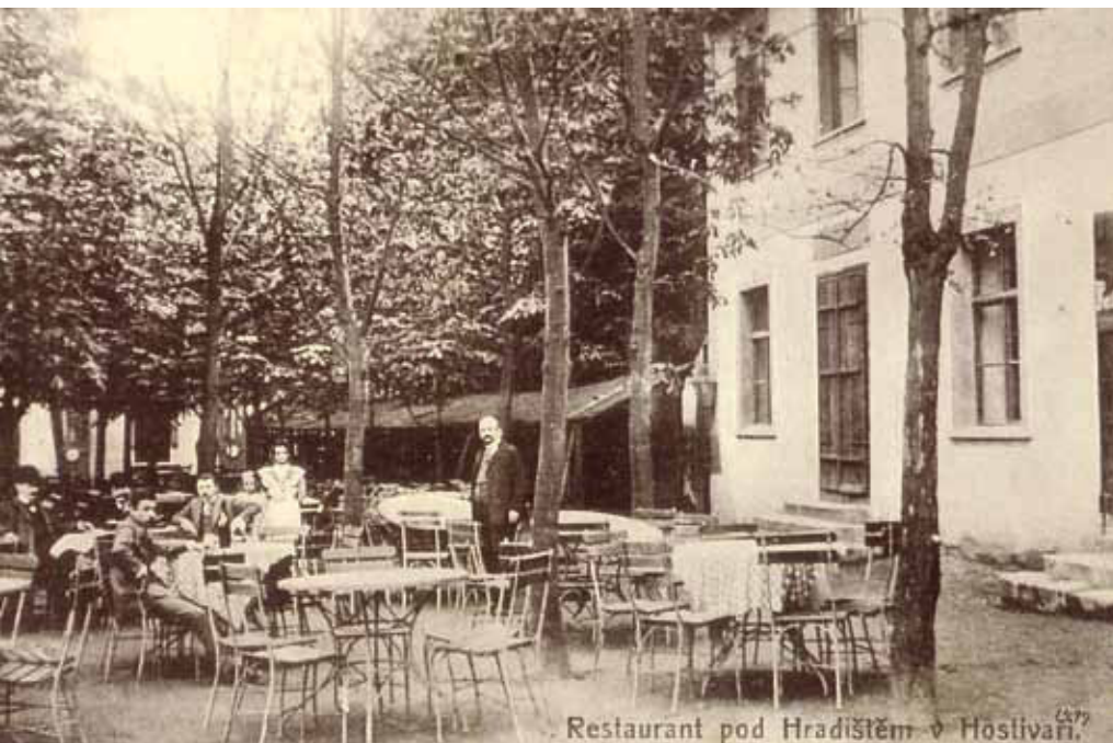
Pohled na zahradu restaurace z roku 1911. Z hlavní budovy někdejšího honosného podniku a hotelu jsou již rozvaliny, z její jedné části vznikla dnes nová hospůdka Pod Hrází.